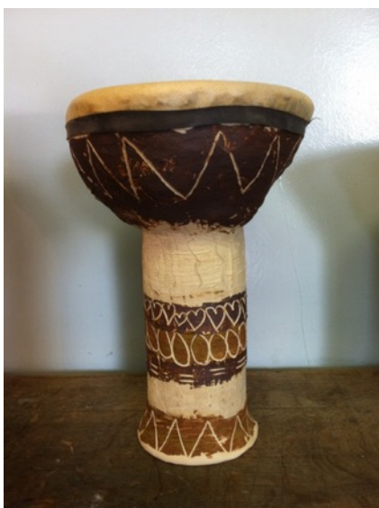
Darbouka membrane collée

Durée: une à trois journées - Tarif première journée: 250€, deuxième: 200€, troisième: 150€ - tous les matériaux sont fournis ainsi que la cuisson et les frais d'envoi des instruments.