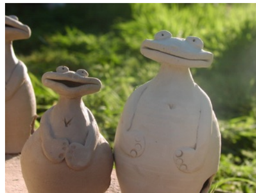
Tambours à friction: grenouille et cuica