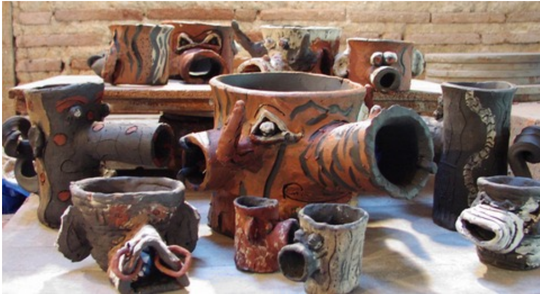
Tambours de table