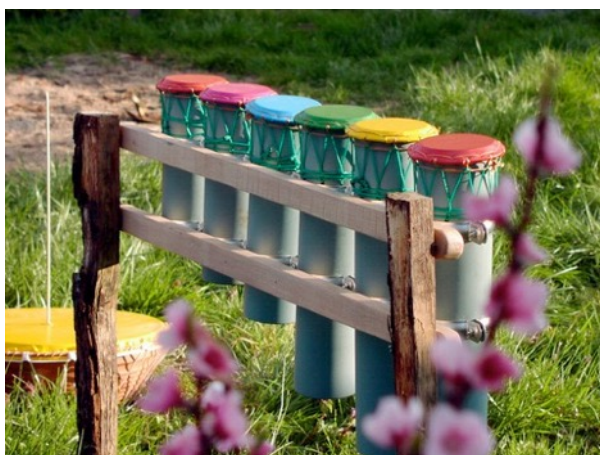
Multi tambours cerclés