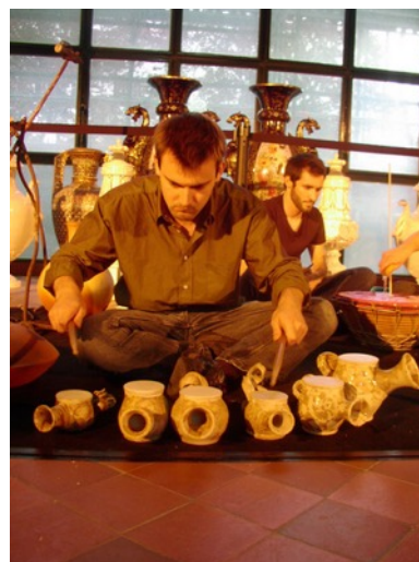
Ensemble de tambour arrosoir