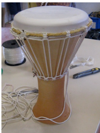
Darbouka avec cordage