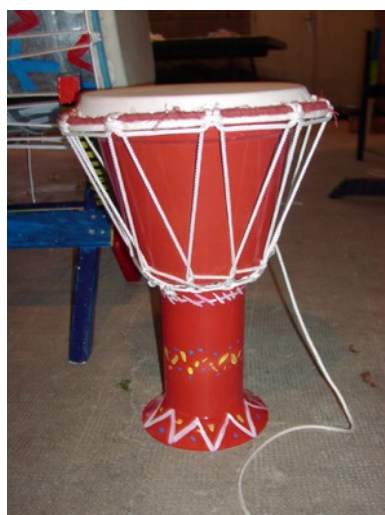
Darbouka pot de fleur et PVC