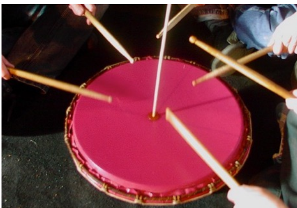
Timbale et timbale à friction