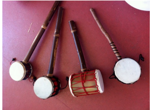
Tambour à boules fouettantes en PVC