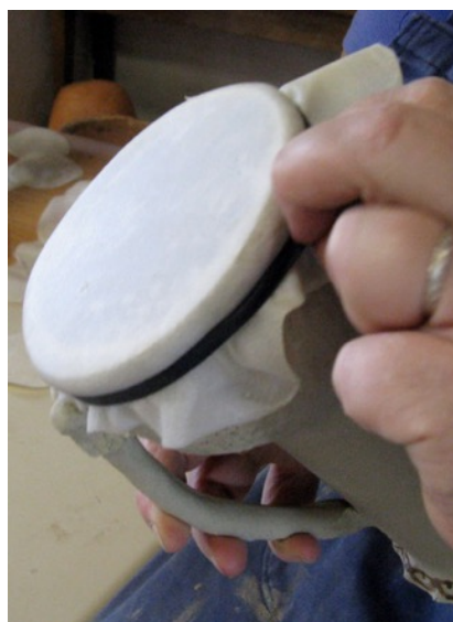
Petit tambour long