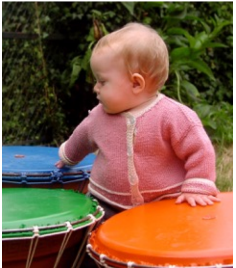
Pour les tous petits, à partir de la crèche, il est préférable, par sécurité pour eux d'enlever la tige centrale