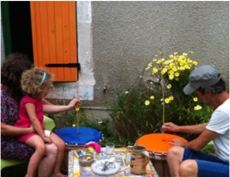
Pour imiter, du barrissement des éléphants aux langages variés des singes, guenons et gorilles...