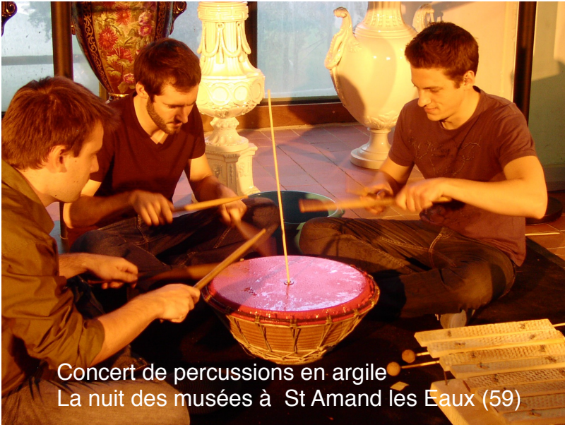
Concert de percussions en argile La nuit des musées à St Amand les Eaux (59)