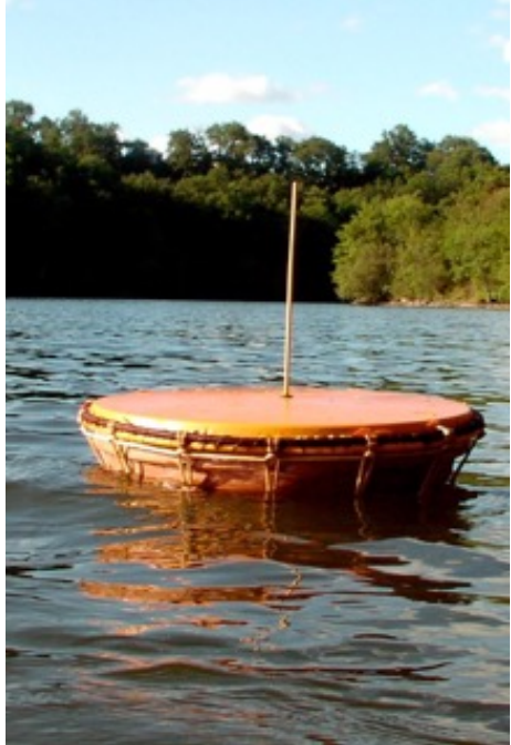
Pour jouer sur l'eau, sous l'eau, pour découvrir des figures acoustiques et le chant des baleines à bosses