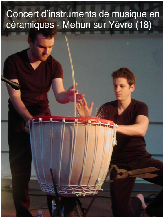
Concert d'instruments de musique en céramiques - Mehun sur Yèvre (18)